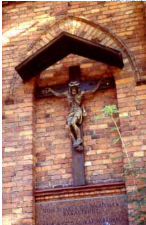
Pyhän Henrikin katedraalin ulkoseinän krusifiksi.