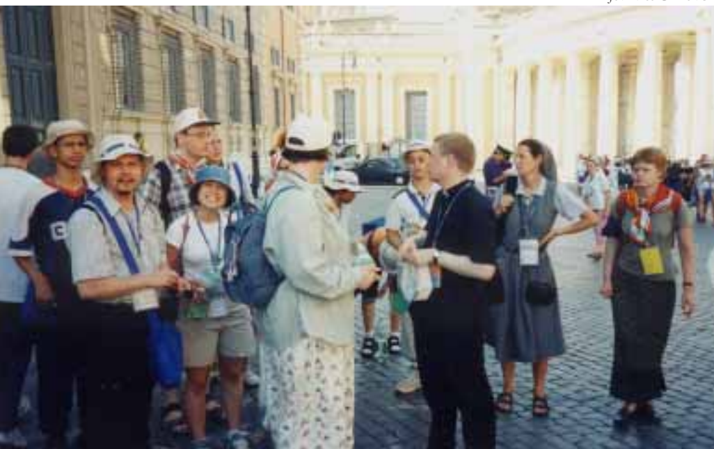
Suomalaiset pyhiinvaeltajat Maailman nuortenpäivillä Roomassa viime vuonna.