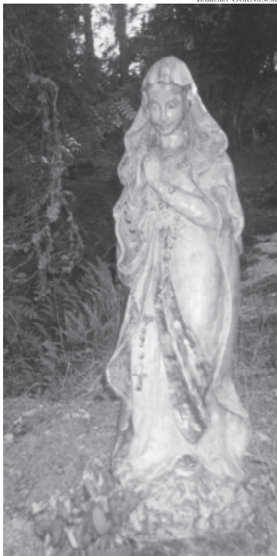
Meidän Rouvamme patsas uudessa Stella Marisissa.