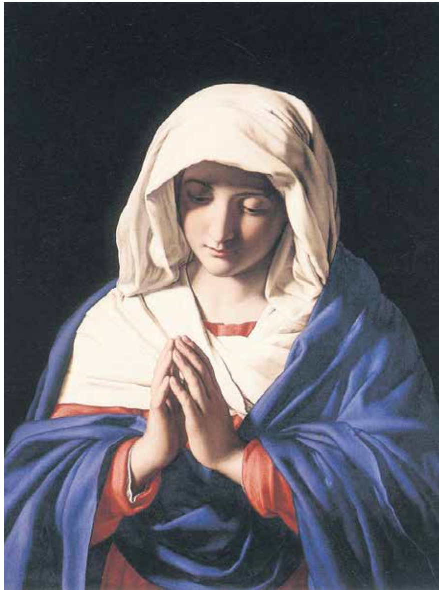
Maalaus "Vergine Maria", Sassetto, 1640-50

[24] Vatikaanin II kirkolliskokouksen mukaan Marian äitiyden jatkuvuus näkyi hetkenä, jona kirkko syntyi ja ilmeni täysin maailmassa. "Koska Jumala ei tahtonut ilmoittaa ihmiskunnan pelastuksen sakramenttia juhlallisesti ennen kuin oli vuodattanut Kristuksen lupaaman Pyhän Hengen, näemme apostolien helluntaipäivää odottaessaan 'pysyvän yksimielisinä rukouksessa naisten kanssa, ja Marian, Jeesuksen äidin kanssa ja Jeesuksen veljien kanssa' (Ap.t. 1:14). Näemme myös Marian rukouksillaan anovan Pyhän Hengen lahjaa, hänen, joka jo enkelin ilmestyksessä oli varjonnut hänet" (Lumen gentium 59). Pyhän Hengen vaikutuksesta toteutuneessa armon pelastustaloudessa on siis ainutlaatuinen vastaavuus Sanan lihaksitulemisen ja kirkon syntymän välillä. Näitä kahta hetkeä yhdistävä henkilö on Maria: Maria Nasa-