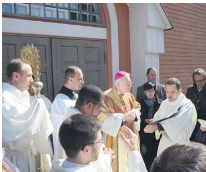
Kannen kuva: Pyhän Joosefin kirkon vihkiminen Kuopiossa 3.5.2014.